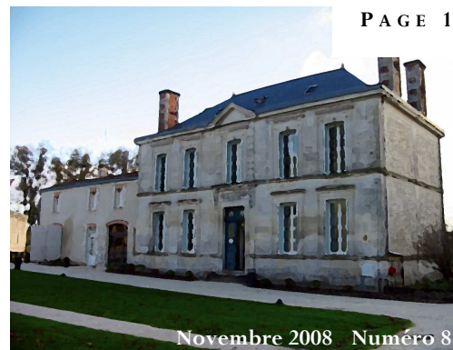
Novembre 2008 Numéro 8